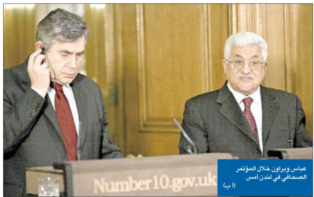
عباس وبراون خلال المؤتمر الصحافي في لندن أمس

اتفاق التهدئة في مهبّ الانتخابات الإسرائيلية